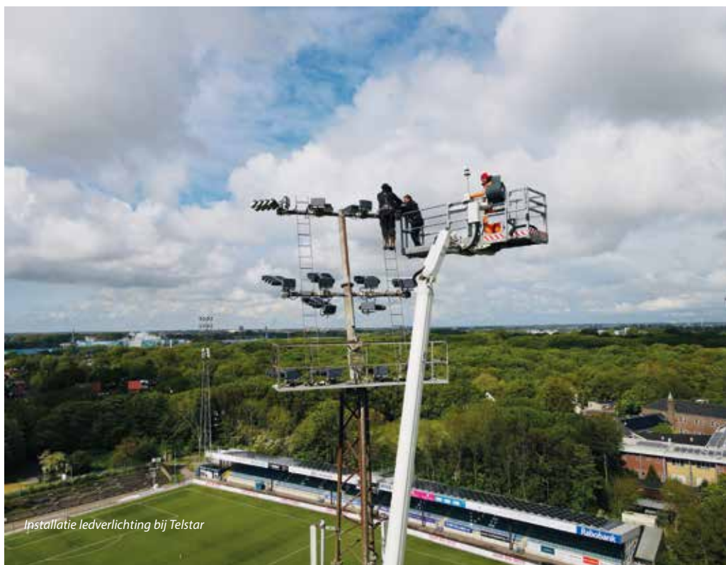
Installatie ledverlichting bij Telstar

wel 60 à 65 procent te realiseren is. Er is nauwelijks een goede reden te bedenken om niet over te gaan op ledverlichting.