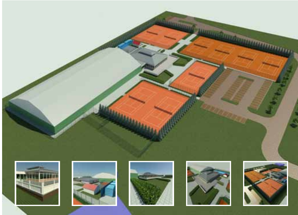
De vereniging heeft besloten om het park in één keer toekomstbestendig te maken.