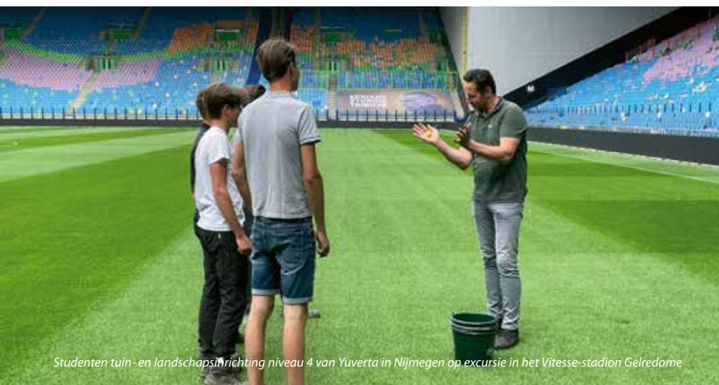
Studenten tuin- en landschapsrichting niveau 4 van Yuverta in Nijmegen op excursie in het Vitesse-stadion Gelredome