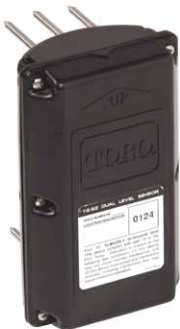
Turf Guard systeem van Toro.