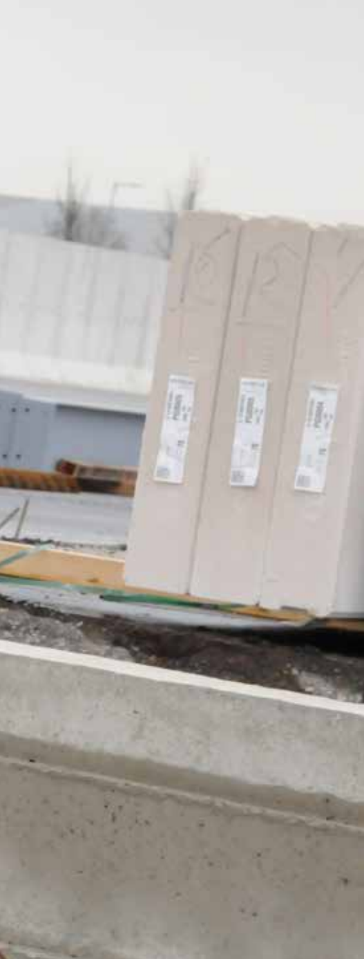
De bouwvergunning is binnen

www.fieldmanager.nl/article/32268/faciliteit-gbn-agr-in-april-volledig-in-bedrijf