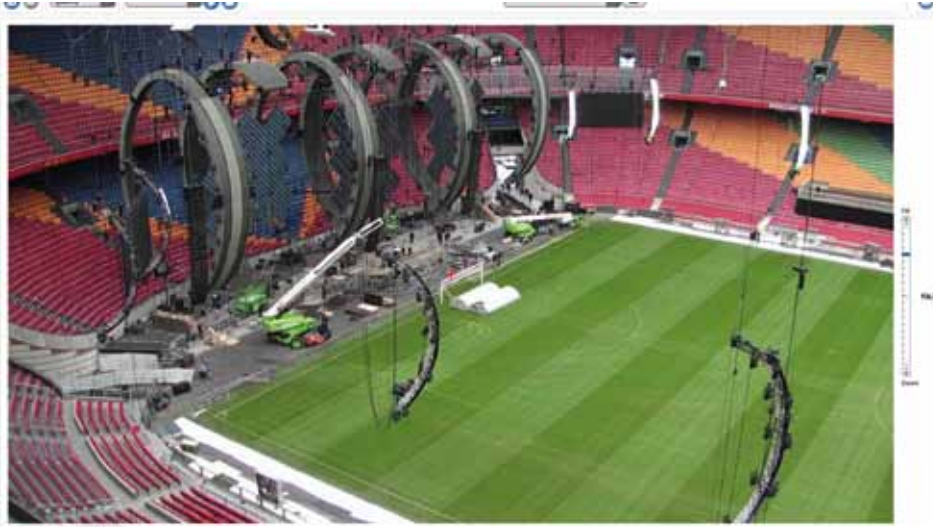
Knottnerus: 'Stadions met multifunctioneel gebruik en veel events profiteren van de snelle verwijdering en aanleg van een Playmaster-veld.'