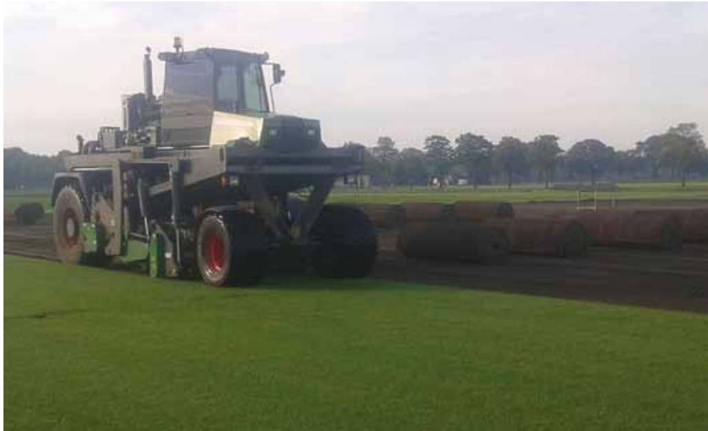
Oogsten hybride-graszoden bij Hendriks Graszoden.

Vorig jaar heeft de Amsterdam Arena proeven