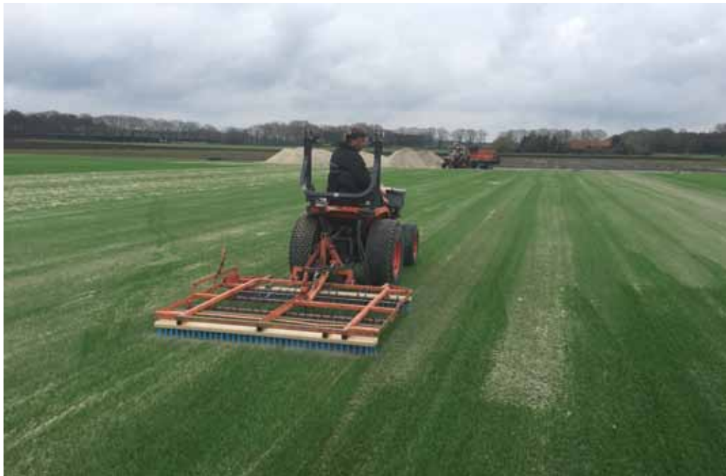
Aanleg hybride-graszoden bij Hendriks Graszoden.

gedaan en gekeken of een dergelijk hybrideveld de periode van de zomer tot aan november goed zou doorstaan, inclusief afdekking ten behoeve van een evenement. Na een jaar monitoren waren de resultaten positief: de Lay & Play-hybride-graszoden van Mixto hielden zich beter dan de traditionele graszoden en doorstonden ook afdekking in het najaar goed. Knottnerus: 'De Amsterdam Arena en AFC Ajax zijn zeer tevreden met deze hybride-graszoden en willen doorgaan met een dergelijk type hybrideveld. Omdat er dit jaar wel