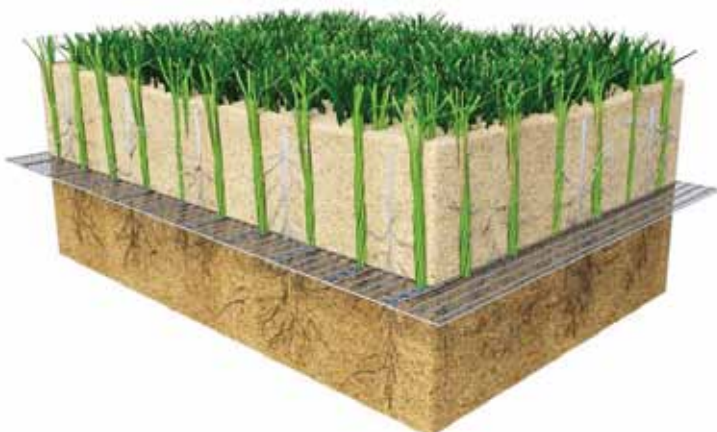
3D-weergave van het Playmaster-vel.

Playmaster lijkt in wezen veel op andere hybridevelden die bestaan uit een ingezaaide backing met vezels. Deze velden kunnen toch langer mee dan enkele seizoenen? 'Kletsboek,' zo reageert Knottnerus duidelijk. 'Het bewijs dat dit type hybridevelden na bijvoorbeeld vijf jaar nog steeds zaligmakend is, is nog door niemand geleverd; eerder integendeel. Wij willen geen valse verwachtingen scheppen bij de klant. Playmaster zorgt gedurende een korte periode voor geweldige speeleigenschappen. Maar na enkele jaren is de kaars opgebrand.'